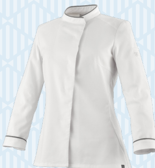
Blanc - Gris chiné